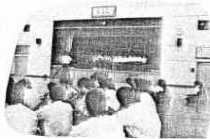
大好きな広島と別れ

さて、11月21日(水)の掃除時間の時に、3階の渡り廊下から、通行人の方に少量ですが水をかけ、罵声を浴びせた行為は許されぬことです。その学年では、学年集会や学級集会を